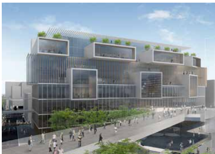
枚方 T-SITE 完成イメージ

「タオルからはじまる、豊かなくらし」をコンセプトに、国内26店舗を展開しているタオル専門店「伊織」は、2016年5月16日（月）にグランドオープンする「枚方 T-SITE」（大阪府枚方市岡東町12-2）に、5月16日から約3ヶ月間、期間限定ショップを展開いたします。TSUTAYA創業の地である「枚方」は、代官山、湘南に続く、3つ目にして関西初の「T-SITE」です。